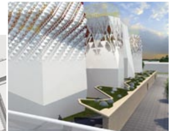
Расположение российского павильона, который с запада ограничен автомобильной дорогой, с юга – мостом ЭКСПО-бульвара, очень удобно и позволяет обеспечить хороший подъезд и пешеходный подход к объекту.

– У нас появится опыт представления страны на масштабном мировом форуме. Сейчас Россия уже другая страна: она стала мощнее и сильнее. Россия – эффективный член мирового сообщества. Все это дает нам все основания, в случае принятий соответствующих государственных решений, выиграть право проведения Всемирных универсальных выставок в будущем.