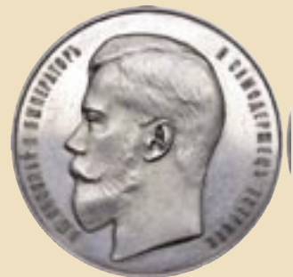
Серебряная медаль Всероссийской промышленной и художественной выставки 1896 года в Нижнем Новгороде