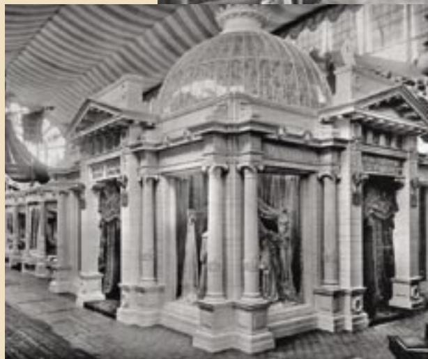
Стенд Прохоровской Трехгорной мануфактуры в Москве