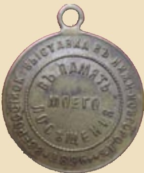
Медаль в память посещения Императором Николаем II Всероссийской промышленной и художественной выставки 1896 года в Нижнем Новгороде

Объяснить это достаточно просто, если заметить применяемый в XIX веке термин «кустарное производство» на «малый бизнес». Дело в том, что само слово «промыслы» тогда понималось совершенно иначе, чем сегодня. В наши дни это, прежде всего, Гжель и Хохлома, сувениры, одежда ручной работы, тогда – практически все, за редчайшим исключением, виды промышленных товаров.