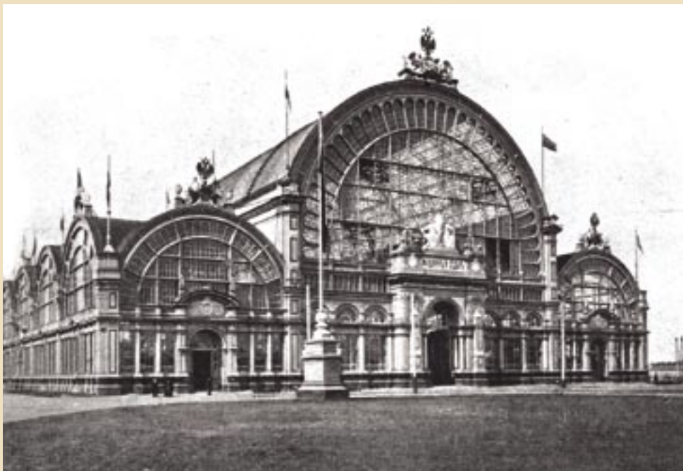
Главное Здание Машинного отдела