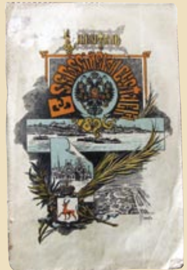
Справочный указатель Всероссийской промышленной и художественной выставки 1896 года в Нижнем Новгороде

Интересный факт: в 1896 году в Российской Империи работало около 7 миллионов кустарей, что в 6 раз превосходило общее количество фабрично-заводских рабочих. В промышленно развитых губерниях количество кустарей доходило до 10% населения. 1