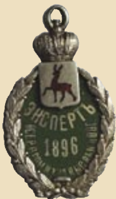
Нагрудный знак эксперта Всероссийской промышленной и художественной выставки 1896 года в Нижнем Новгороде

Почти половина всех посещений (434704) пришлось на один месяц – август, время открытия знаменитой Нижегородской ярмарки – гигантского, крупнейшего в России, оптового рынка. Ежегодно, в течение двух месяцев, на него завозили и вывозили сотни тысяч пудов самых разных грузов.