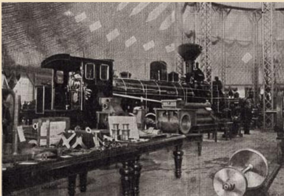
Павильон в виде паровозного депо для демонстрации работающих паровозов

Состояние морской торговли иллюстрировала коллекция, собранная Восточной экспедицией Министерства финансов. Ну и, конечно же, в павильоне чаеоторговцев самым широким и подробным образом демонстрировалось чайное дело – образцы почв и сорта чая, модели машин, иллюстрации производственных процессов и пр. 1