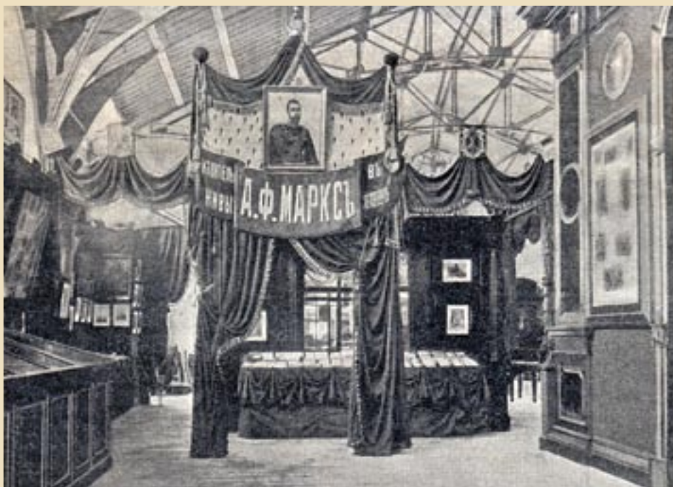
Стенд издательства А. Ф. Маркса, получившего сразу две награды: эксперты Художественно-промышленного отдела присудили Право изображения Государственного Герба, их коллеги из Отдела народного образования, охранения народного здоровья, благотворительности, подачи помощи страждущим и спасения на водах – диплом I разряда

Отметив полную самостоятельность экспертизы, устранение всяких личных влияний, и указав, что из 9700 экспонентов награждены 5925, оратор очертил состояние отдельных отраслей промышленности, как они выяснились по результатам экспертизы. «Выставка дала нам сознание своей силы и самостоятельности», – закончил он... После гимна, покрытого кликами «ура», раздавались списки наград». 6