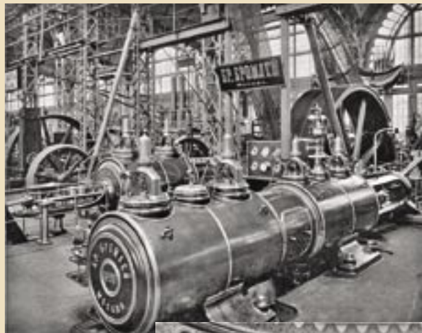
Экспозиция Машинного отдела

«Известия Всероссийской промышленной и художественной выставки 1896 года в Нижнем Новгороде», №33. 2 июля 1896 г.